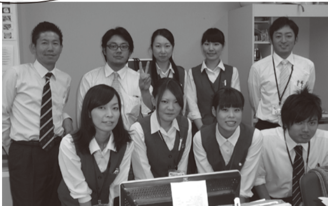
若いスタッフの多い職場ですが、精一杯がんばります！