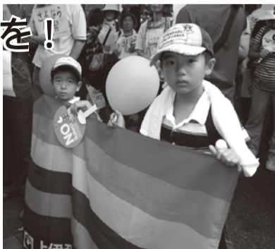
子どもたちの未来のためにも、ご協力ください!!(9/19、明治公園の『さよなら原発』5万人集会にて)