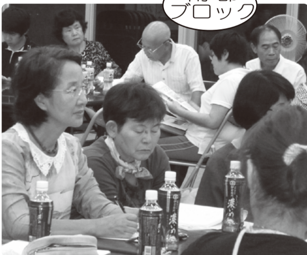
資料を手に、経験報告を真剣に聞く参加者(飯島町成人大学センターで)