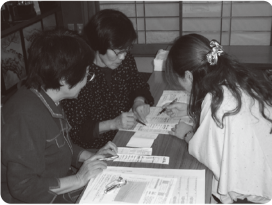
9/26の末広班会は、居住職員がはじめて地元で開催しました！