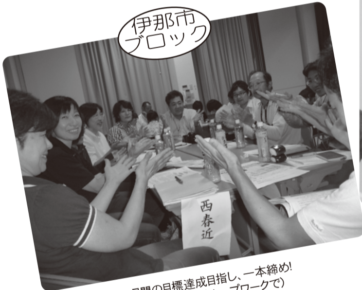
月間の目標達成目指し、一本締め! (西春近支部グループワークで)