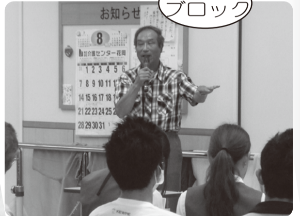
積極的に打って出る、楽しい活動をよびかけました(病院デイケア室で)