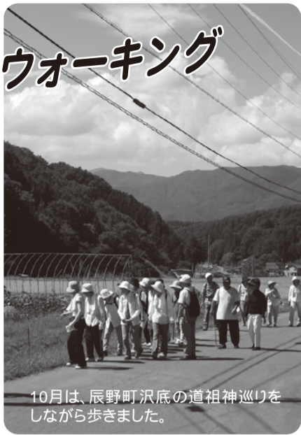
10月は、辰野町沢底の道祖神巡りをしながら歩きました。

今年も5月から10月までの5回、さわやかウォーキングを実施しました。5月は雨のため中止となりましたが、今年度のテーマ「地域の史跡・名所を巡りながらのウォー