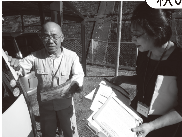
署名をお渡しすると「今の世の中、こういう運動は大事だな」 (高遠の訪問行動で)

強化月間もいよいよ大詰めです。今年度は、「月間スタート集会」を北部・伊那市・南部の3ブロックで開催し、支部・事業所から多数の参加がありました。グループワークでの計画をもとに、各支部で行動が旺盛に展開されています。仲間ふやし・訪問回数など昨年度比2.5割増となっている、各支部の元気な様子をお伝えします。