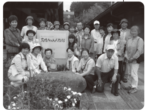
8/25、飯山『高橋まゆみ人形館』へのバスハイクで交流を深めました。

駒ヶ根支部では、ほそぼそと組合員の拡大や増資に取り組んでいますが、なかなか飛躍的な拡大が出来ずにあります。