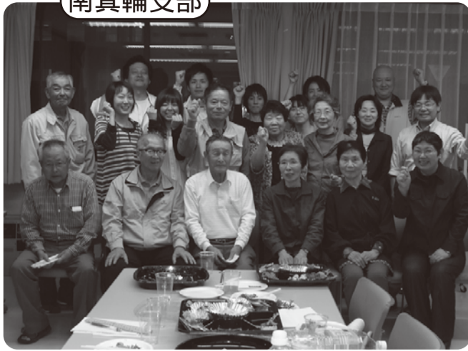
久しぶりに組合員・職員がふれ合った記念に、集合写真を撮りました！(9/27 南箕輪支部交流会にて)